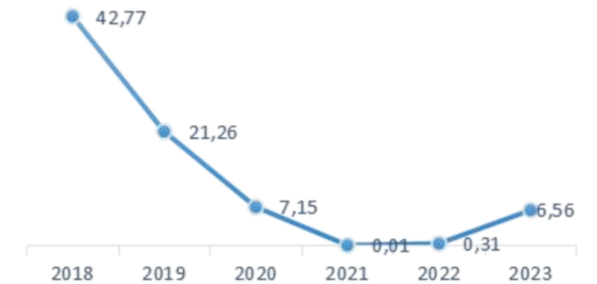
Incidența rujeolei - România 2018-2023

Sursa: INSP - insp.gov.ro/download/buletin-informativ-bolile-infectioase-si-parazitare-9-luni-2023-comparativ-cu-9-luni-2022/